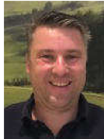
James Round Region West